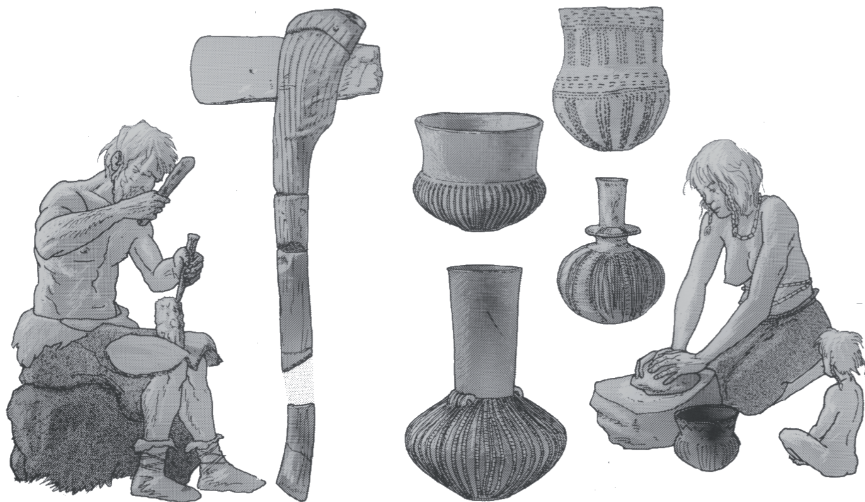
Dysserne er kun ét eksempel på bondestenalderens tekniske formåen. Også flinthugning og keramikfremstilling stod højt.