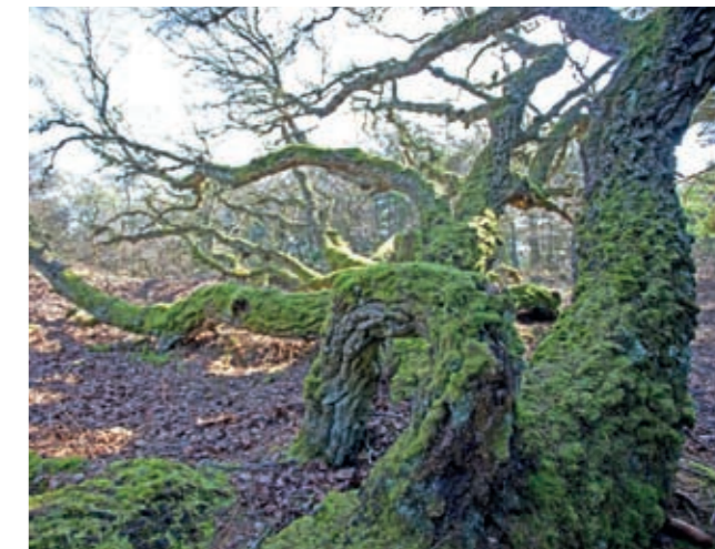
Næsten 200 år gammelt birketræ.

I husets vestlige ende blev tilføjet en ca. 10 m lang forlængelse samt en vinkelbygning mod syd. Her har nok været stald og lade. Indretningen med stald i bryggerset og lade mod vest kender vi fra andre gamle huse i Thy. Vi ved fra skriftlige kilder, at klitløberen Mads Bedsted brugte laden til at opstalde de får, han fangede ind ude i klitten. Det fremgår af de problemer der opstod, da fårene en dag i 1835 væltede det øl, Mads Bedsted havde til at stå i laden.