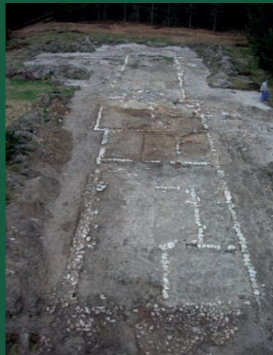
Fra udgravningen af Tvorup Skovhus. Syldstenene viser husets grundplan.