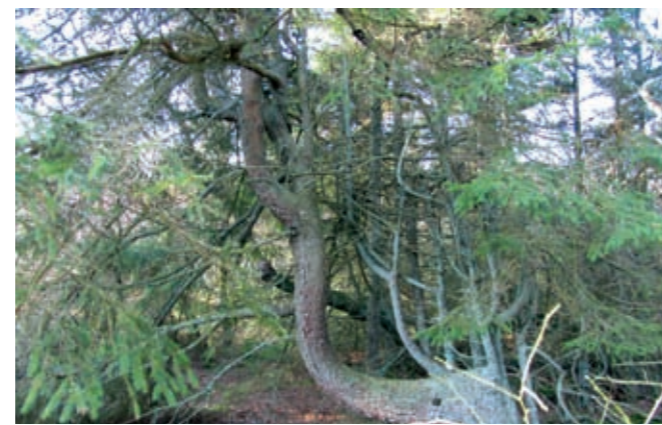
Rødgran med mange topskud.

Under en vandring i plantagen i dag finder man flere af de oprindelige beplantninger. Rødgran og birk dominerer. Rødgran med mange kandelaberagtige former som følge af gentagne ødelagte topskud og lave nedhængende grene, der har slået rødder. Birk som efter vindpåvirkning har udviklet troldekskovsagtige former. Bævreasp findes i mængde, og der er enkelte skovfyr og rødæl. I plantagen ser man et omfattende grøftesystem. I skellet mod sydvest er der et stort velbevaret dige. I nordkanten omkring midten findes et mindre, men dog tydeligt dige. I sydkanten støder man på nogle korte parallelliggende lave diger på tæt afstand. Her har måske ligget en lille lokal planteskole, som blev lavet omkring 1828.