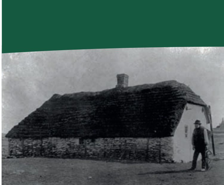
Hus fra Vorupør af samme type som Tvorup Skovhus.