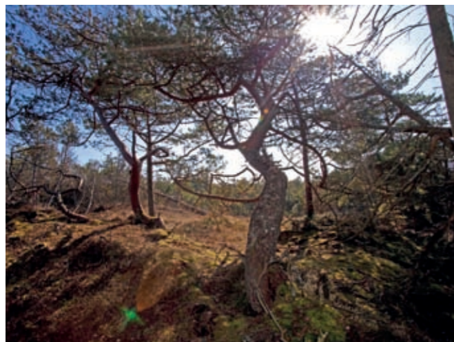
Mangestammet skovfyr fra plantagens start.

På trods af de nedslående resultater, blev der allerede i 1850'erne gjort nye forsøg på træplantning, men denne gang med andre træarter og på andre lokaliteter – blandt andet ved "Gryden" i den østlige del af Tvorup Plantage. Det lykkedes langt bedre, og nu startede en gigantisk forvandling af klitlandskabet. I løbet af få årtier var et tæppe af bjergfyrrullet ud over de mest sandflugtsramte dele af Thy, og de nuværende klitplantager var en realitet.