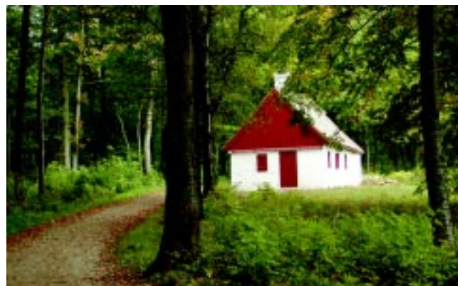
Anes hus – fuld af historie

Et overdrev defineres som en græsdomineret vegetation på tør bund uden anden påvirkning end græsning. I gamle dage fandt man overdrevene på svært tilgængelige og dermed ikke opdyrkede områder som skrænter og kuperede arealer. Med industrialiseringen af landbruget er overdrevene blevet en truet naturtype, som er bevaringsværdig pga. den store variation af planter og dyr. I dag er 88 truede plantearter tilknyttet overdrevet, hvilket svarer til 38% af samtlige truede plantearter i Danmark. Alle overdrev er fredet iflg. Naturbeskyttelsesloven § 3, og udgør kun 0,9 % af landbrugsarealet, eller ca. 28.000. ha.