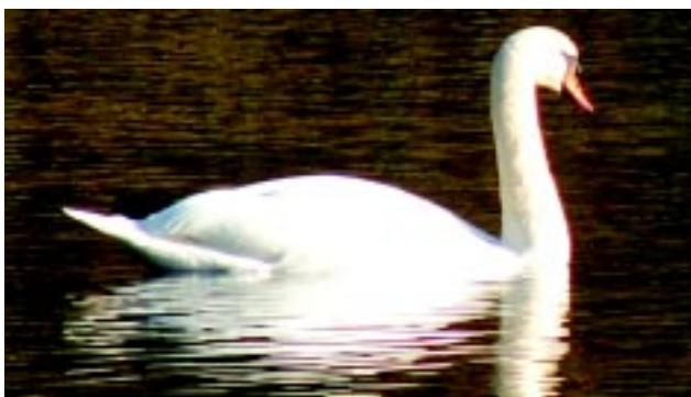
Knopsvanen er en fast gæst i Kohaven

Den mest iøjnefaldende ynglefugl er grågåsen. Den kan især ses i den nordlige del af Kohaven omkring Pernille Sø. Her kan også ses både lille og gråstrubet lappedykker. Den fugl, der høres mest, er nattergalen. Den sidder flere steder rundt i krattene, og dens klukkende stemme høres i maj og juni, især om aftenen og natten. I ellekrattene kan man få et glimt af den sjældne lille flagspætte, og fra de store, gamle egetræer høres den korttåede træløbers korte, svirrende sang.