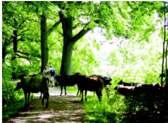
Kohaven – et sted for folk og fæ

Helsingør – Hornbæk – Gilleleje Banen (HHGB) stopper ved Hellebæk station. Endvidere går bus nr. 347 og 331 til stoppested i Nygård, hvor der er ca. 400 meter til den vestlige del af Kohaven.