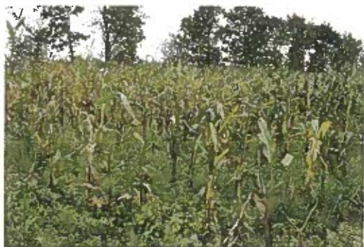
Majsen står elendigt efter kronhjortenes nedbidning.