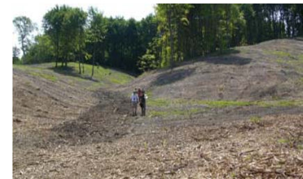
Jydelejet, Møns Klint