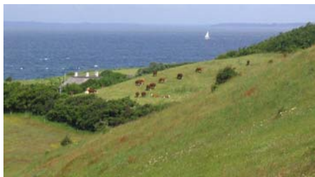
Nordby Bakker, Samsø