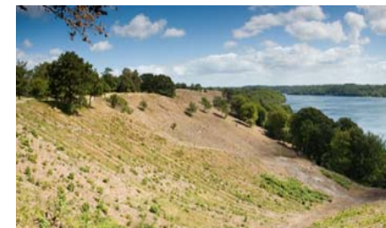
Dollerup Bakker, Hald Sø