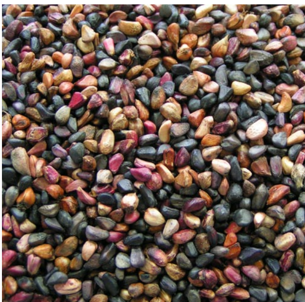
Farven på frø af klitrose kan variere meget.

Bevoksningen blev i 1994 anlagt på Tuse Næs arealerne. Planterne står på stor afstand, dels for at udvikle fyldige buske og dels for at lette frøhøsten på arealet.