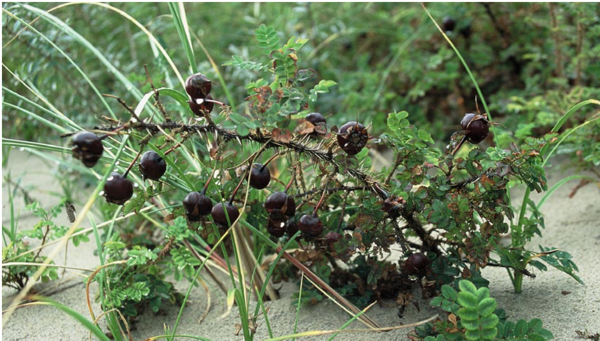
Klitrose på sit naturlige voksested

Vækst: Klitrosen er en lille busk, som kan blive op til ca. 1 meter høj. Normalt vil den i klitten være på 10 – 30 cm høj.