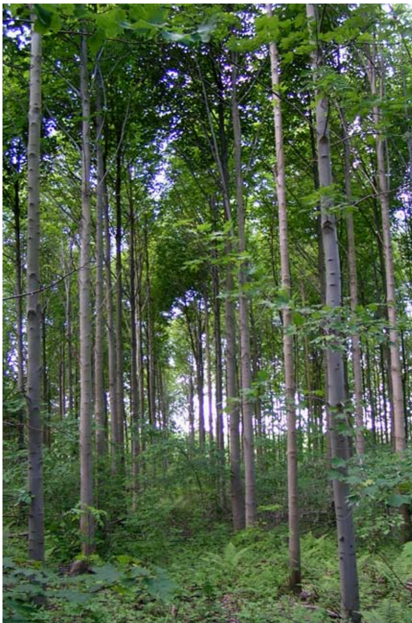
F.804 „Vestskoven“ juni 2006

Sundhed: Træerne i bevoksningen fremstår som sunde; men det er ikke muligt at vurdere sundheden under mere udsatte vækstforhold. Bevoksningen er derfor ikke kåret til værn og læ.