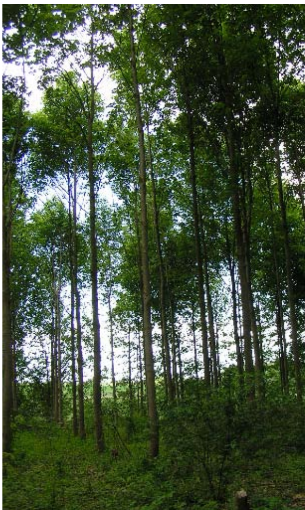
F.804 „Vestskoven“ juni 2006