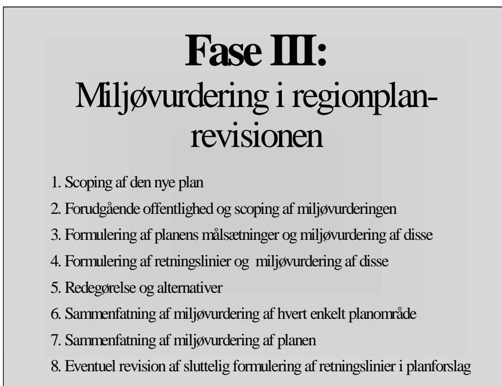
Figur 2: Miljøvurdering i regionplanrevisionen – Fase III

Forløbet i Fase III illustrerer ikke blot de enkelte trin i planprocessen, men også hvad der kan betegnes en rullende reversibel planproces. Miljøvurderingen medfører at der bestandig kan ske en revision af udgangspunktet for ethvert trin i processen, hvis det efter en nøjere vurdering af de miljømæssige konsekvenser viser sig, at dette kunne udformes mere hensigtsmæssigt.