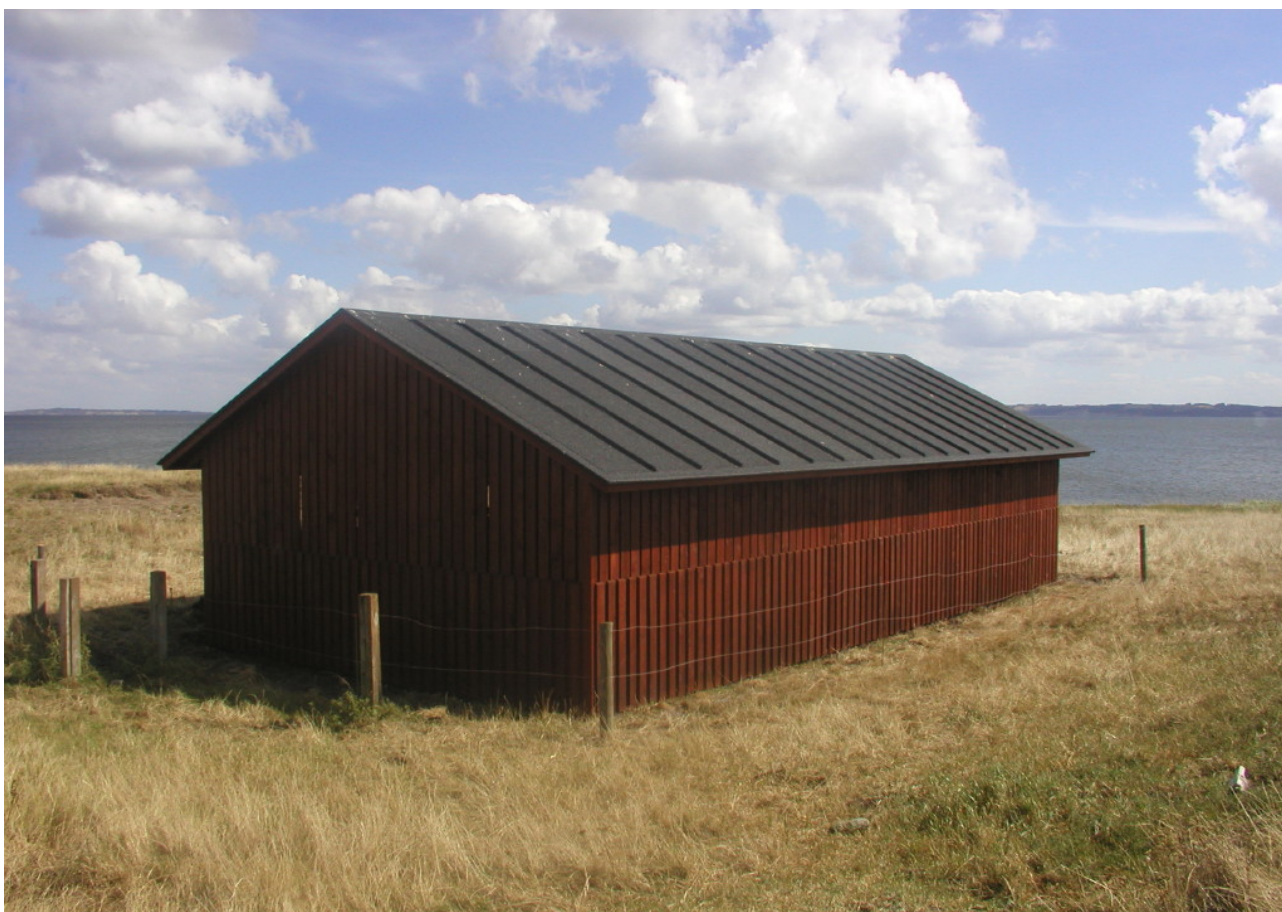
Billede 3 Beeshuset – genopført i 2003

Naturstyrelsen ejer selve Buksør Odde med halvøen Tamholm, i alt 39 ha.