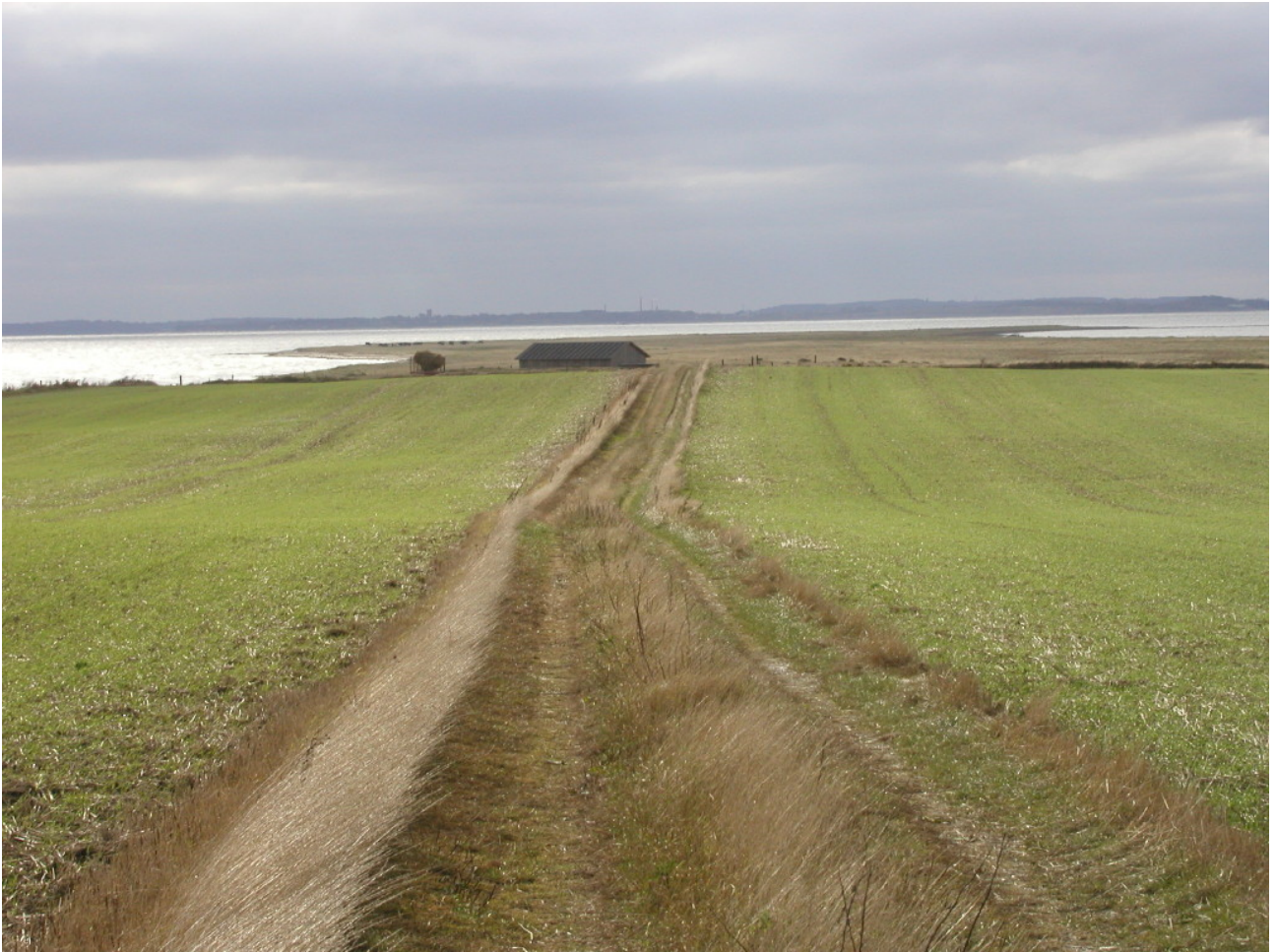
Billede 2 Buksør Odde