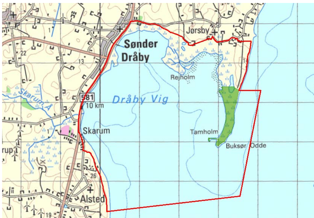
Billede 1 Oversigt over Natura 2000-områdets afgrænsning (rød streg) og styrelsens arealer (stærk grøn farve) i området.

Denne plejeplan følger op på Natura 2000-planen for område N29 Dråby Vig og vedrører Naturstyrelsens arealer på 39 ha.