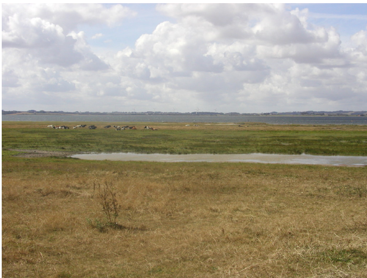
Billede 4 Strandeng med køer og Dråby Vig i baggrunden.

Tabel A viser Naturstyrelsens arealer med kortlagte naturtyper i området.