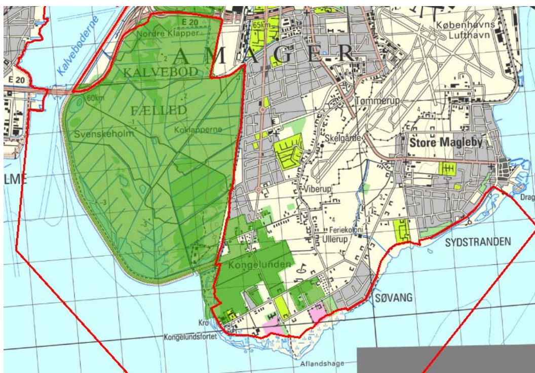
Billede 1 Oversigt over Natura 2000-områdets afgrænsning (rød streg) og styrelsens arealer (grøn farve) i området.

Denne plejeplan følger op på Natura 2000-planen for område N143 Vestamager og havet syd for , og vedrører Naturstyrelsens arealer på 1978 ha.