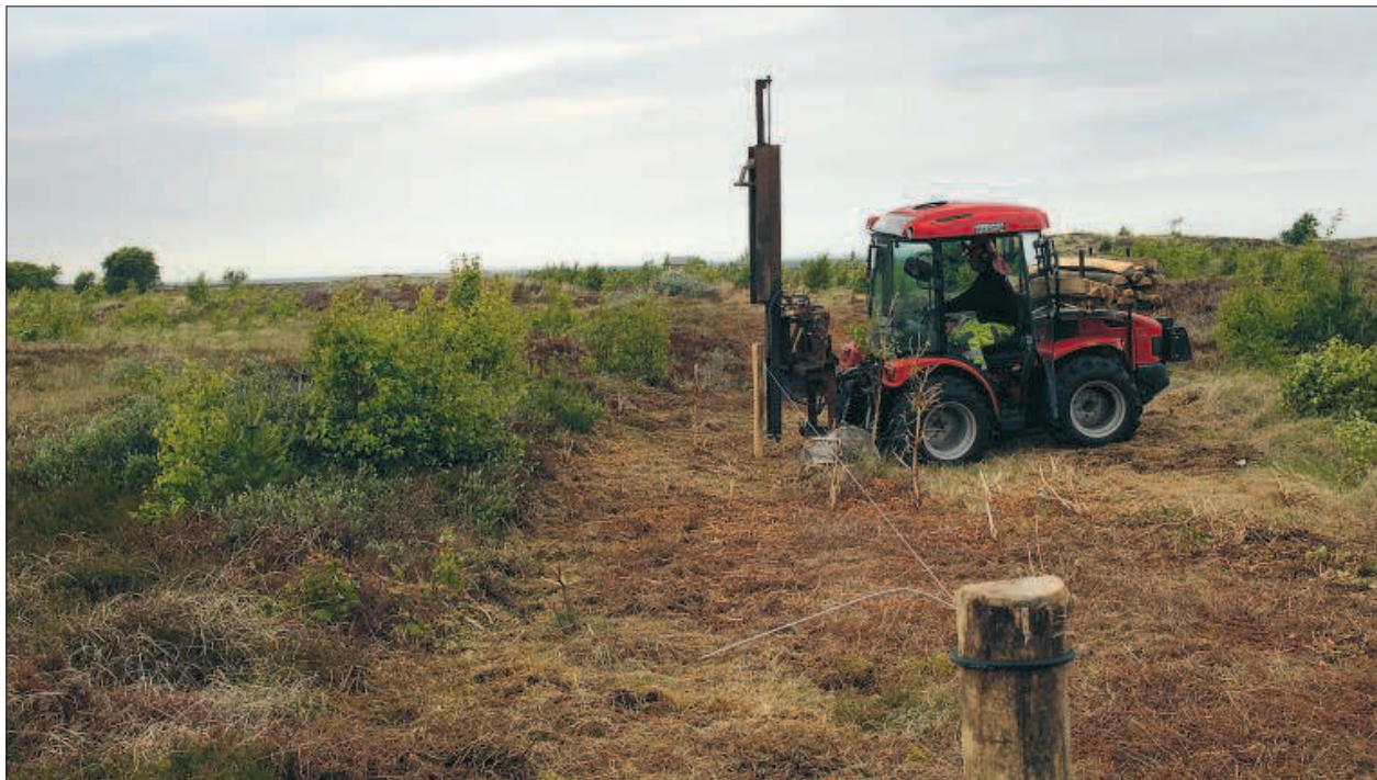
En stor del af de områder, der indgår i lodsejergruppens arealer er allerede blevet indhegnet, og flere hegn er på vej.

naturstyrelsen.dk/naturbeskyttelse/naturprojekter/li-fe-laesoe/