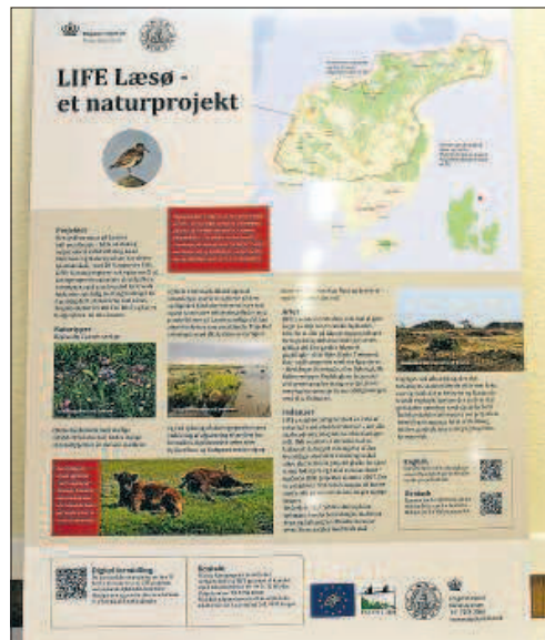
Life Læsø projektet er forbundet med Læsø Natura 2000 Lodsejerforening og en brugergruppe som dialogforum.

Nogle medlemmer har ikke noget imod at lade Fold-