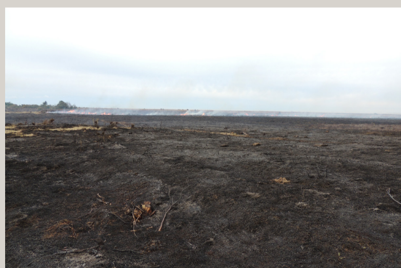
Vellykket afbrænding af den gamle lyng giver plads til nye lyngplanter

og landskabet er præget af tidligere sandfyg- ninger, der gennem århundreder har været betydelige, således at nutidens naturtyper er fattige og primært bevokset med lyng, revling og græsser. Laver er også stærkt repræsen- teret. Nogle af laverne er rester af den første vegetation efter istiden.