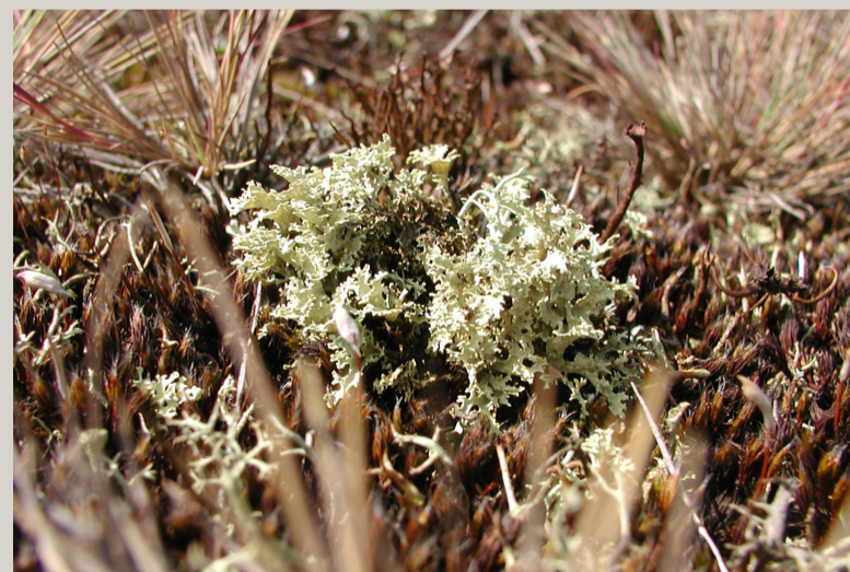
Snekruslav er en af de mere sjældne lavarter man finder i Nordmarken

Netop her ved Banstenen er afgræsning en særlig udfordring, idet det helt overvejende er Vortebirk, der sår sig. Vortebirk har på de yder- ste grene vorte-lignende dannelser, der gør at