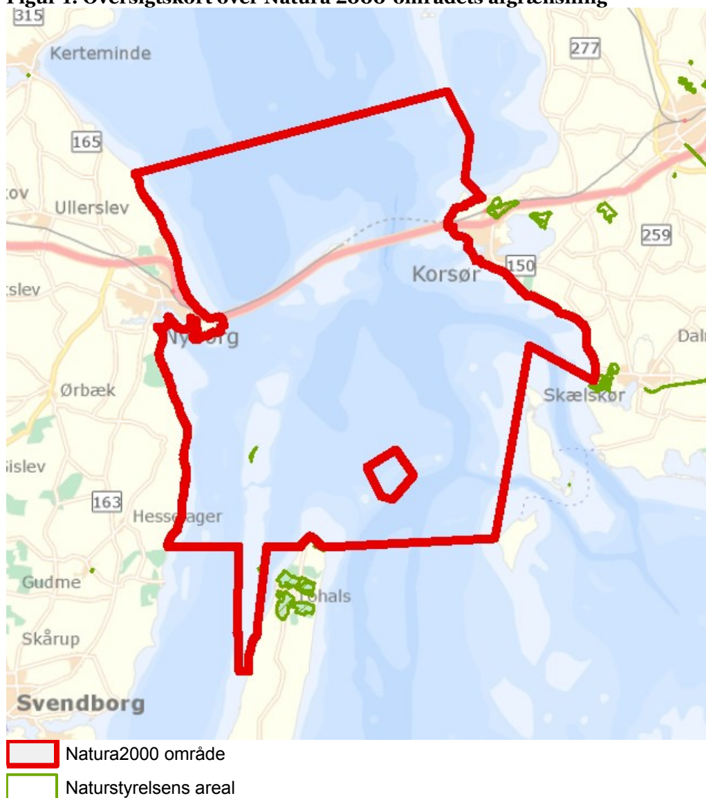
Figur 1: Oversigtskort over Natura 2000-områdets afgrænsning

I denne plejeplan er arealer og indsatser opdelt på henholdsvis lysåbne naturtyper og arter knyttet til de lysåbne naturtyper. Natura 2000 plejeplaner for de skovbevoksede naturtyper, samt mere detaljerede oplysninger om indsatsen i Natura 2000-områderne findes på Naturstyrelsens