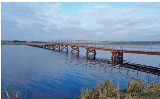
Den nye bro over søen fra 2014.

Vilsted Kajakklub: Holder til i huset ved Vilsted havn. Bliv medlem og få adgang til foreningens kajaker. Se mere her: vilstedif.dk