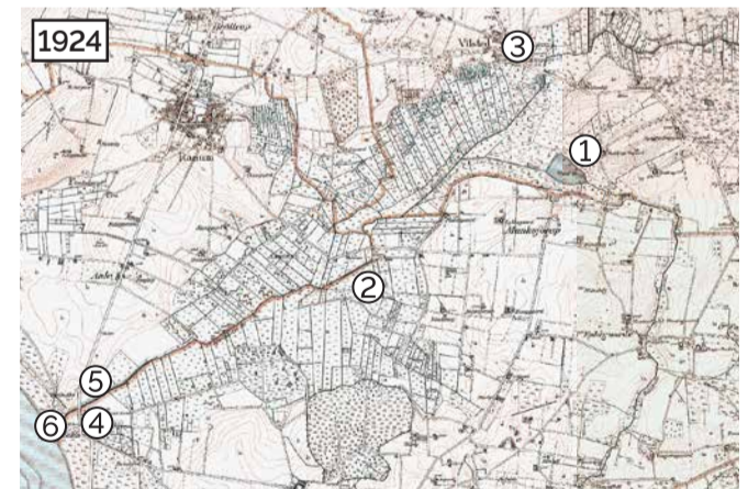
I 1924 er der kun en meget lille del af Vilsted Sø tilbage.

Dårlige faldforhold, tilsanding og bundopskydning i kanalerne og sætninger af tørve- og dyndjorden på op til 1,5 m har bevirket, at intensiv landbrugsdrift i området næsten var ophørt da idéerne om gendannelsen af søen kom frem.