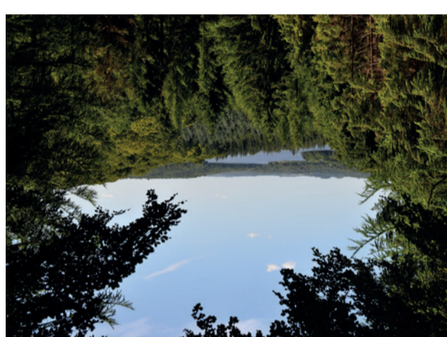
Karoline Amaliehøj 12

over kanalen, er der bålplads med borde og bænke.