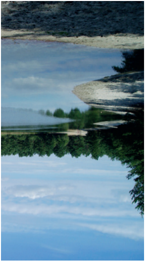
Skovhøjs Sø 9 Flvsesandsområdet Hårup Sande blev tilplantet med skovlyr, bjerglyr og birk i midten af 1800-tallet. Den lyse skov har en rig bundvegetation af især småbuske som lynn, blåbær, mosebølle, lyttebær m.m. Schoubyes Sø er opkaldt efter den skovrider som gav tilladelse til at grave søen, da der i 1958-60 manglede fyldjord til vejprojekter i Silkeborg. Den lavvandede sø er ren og velegnet til badning.