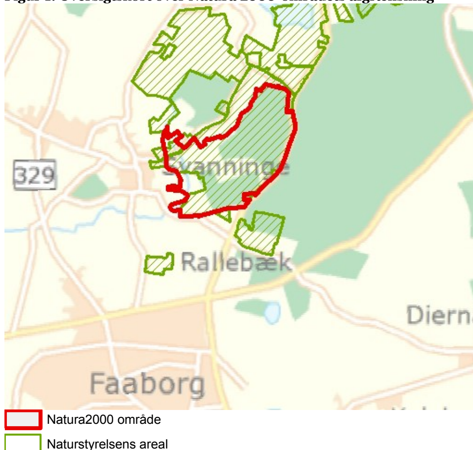
Figur 1: Oversigtskort over Natura 2000-områdets afgrænsning

I denne plejeplan er arealer og indsatser opdelt på henholdsvis lysåbne naturtyper og arter knyttet til de lysåbne naturtyper. Natura 2000 plejeplaner for de skovbevoksede naturtyper, samt mere detaljerede oplysninger om indsatsen i Natura 2000-områderne findes på Naturstyrelsens hjemmeside vedr. Natura 2000. Bemærk, at Naturstyrelsens samlede arealforvaltning i området er omfattet af flere planbestemmelser og retningslinjer end dem, der findes i denne plan. For supplerende læsning herom henvises til Naturstyrelsens driftsplaner for det pågældende område, som findes på Naturstyrelsens hjemmeside vedr. driftsplanlægning.