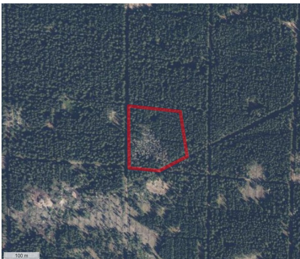
Kortbilag 2. Den røde afmærkning angiver forbudsområdets omfang.