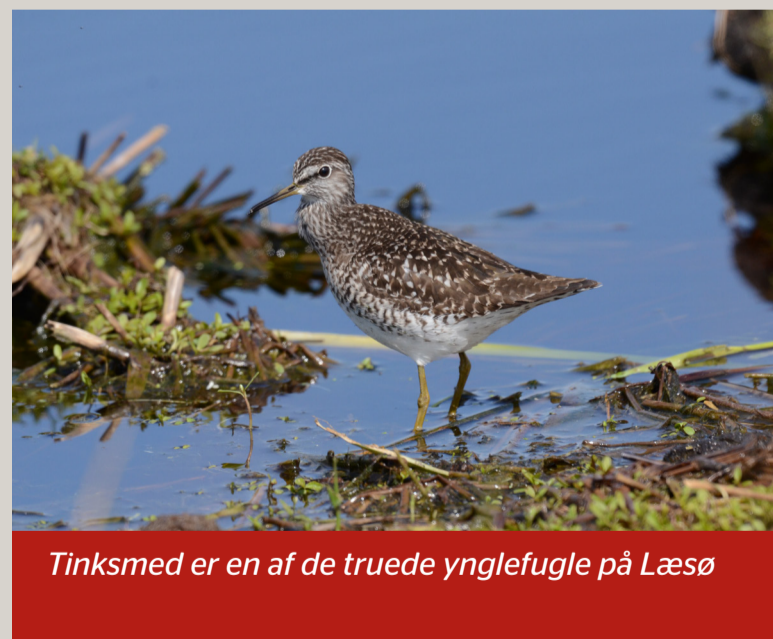
Tinksmed er en af de truede ynglefugle på Læsø

LIFE projektet arbejder sammen med lodsejerne på denne del af øen med rydning af de sidste lommer af skov på Syrsig samt bekæmpelse af Rynket Rose. Sidstnævnte både i klitterne og spredt på de mere tørre lokaliteter