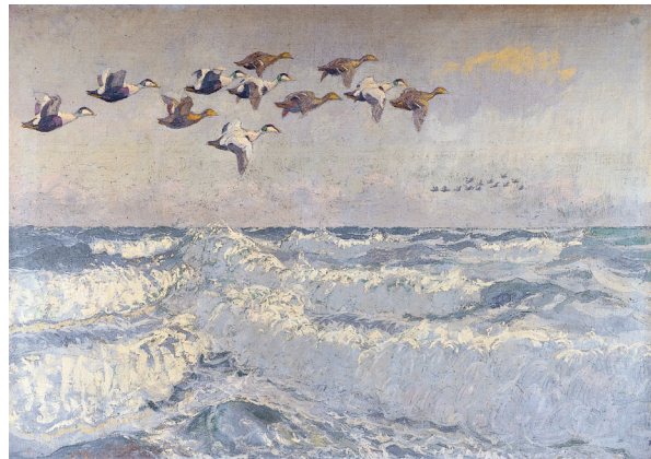
Johannes Larsen: Ederfugletrækket. 1924. Hænger på Christiansborg