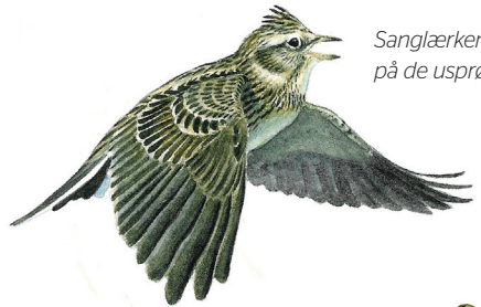
Sanglærken nyder godt af insektlivet på de usprøjtede overdrev.

Det afvekslende landskab med øer, holme, lavt vand og det store Kattegat betyder, at her er fugle at se på alle årstider. Om vinteren især havfugle som toppet skallesluger, sortand, hvinand, alk og små flokke af ederfugle, som ligger rundt langs kysten. Fra det tidlige forår trækker mængder af småfugle og rovfugle mod nord op over Fyns Hoved, som er den nordligste del af Fyn, hvor fuglene har landkending. En tidlig morgen, især efter dis og østenvind, vrirler krattene med småfugle, der venter på at stikke af sted i dagslys. Husk kikkerten og tag på kratlusk. Trækkende rovfugle som musvåge, fjeldvåge, spurvehøg og rørhøg ses bedst fra Horseklint, som regel lidt op ad formiddagen. Om sommeren yngler fugle som fx sanglærke, stenpikker, rødrygget tornskade, gøg og tornsanger på Fyns Hoved. Lyt til de mange fuglestemmer; så snart fuglene har unger, forstummer sangen. Af hensyn til ynglefugle er der ingen adgang på Tornen fra 1. april til 15. juli. En stor del af året ses rastende vadefugle som rødben, strandskade og storspove i det lave vand ved Fællesstrand.