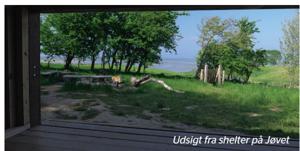
Udsigt fra shelter på Jøvet

På Jøvet findes et shelter med plads til 5 - 6 personer. Shelteret ligger med udsigt over Fællesstrand. Du kan reservere shelteret via www.naturstyrelsen.dk under Naturoplevelser. Du er velkommen til at tage en overnatning, hvis shelteret er tomt.