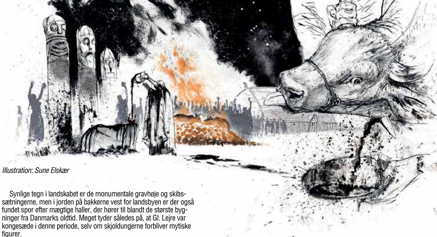
Illustration: Sune Elskær

Ifølge de danske middelalderkrøniker og islandske sagaer var Gl. Lejre det sted, hvor den første danske kongeslægt, skjoldungerne, havde deres kongsgård. Det var konger som Skjold, Rolf Krake, Frode Fredegod og Harald Hildetand. Selvom de eventyrlige myter og sagn - som for eksempel den om krigeren Beowulf, der hjalp Rolf Krake ved at nedkæmpe en drage - ikke er pålidelige historiske kilder, så har arkæologiske udgravninger vist, at Gl. Lejre i perioden 500-1000 e. Kr. var et betydningsfuldt sted.