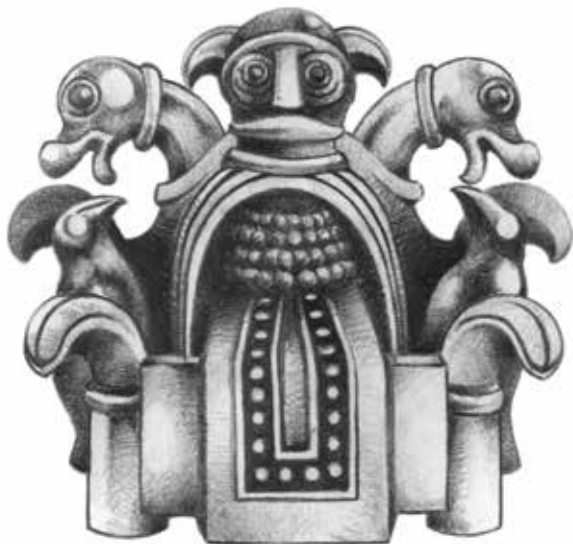
Odin på sin tronstol. Illustration: Rune Knude/Zoomographic

I tiden før Danmark blev kristent, fandtes et magtfuldt center i Gl. Lejre. Her tilbad man Odin, asernes konge, og her mødtes konger og stor-mænd til gæstebud og rådslagning. Her opstod myterne om skjold-unge-kongerne. Følg stiforløbet på kortet ("Monumentstien"), og gå i fodsporene på jernalderens og vikingetidens sagnkonger.