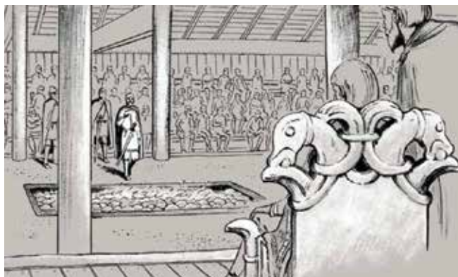
Illustration: Sune Elskær

Ifølge sagaerne og krønikerne rummer gravhøjen de jordiske rester af Harald Hildetand, der ifølge sagnene var den sidste af skjoldungerne. Efter sigende skulle Harald Hildetand være faldet ved Bråvallaslaget i kamp mod en rivaliserende konge. Harald Hildetands Høj er dog betydeligt ældre end vikingetiden. Gravhøjen er en såkaldt langdysse opført i bondestenalderen omkring 3500 f. Kr.