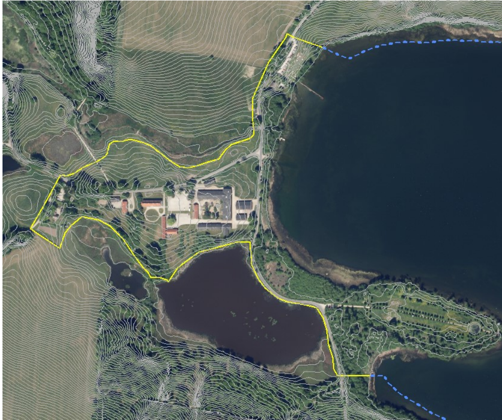
Indre hegn med højdekurver (0,5m)