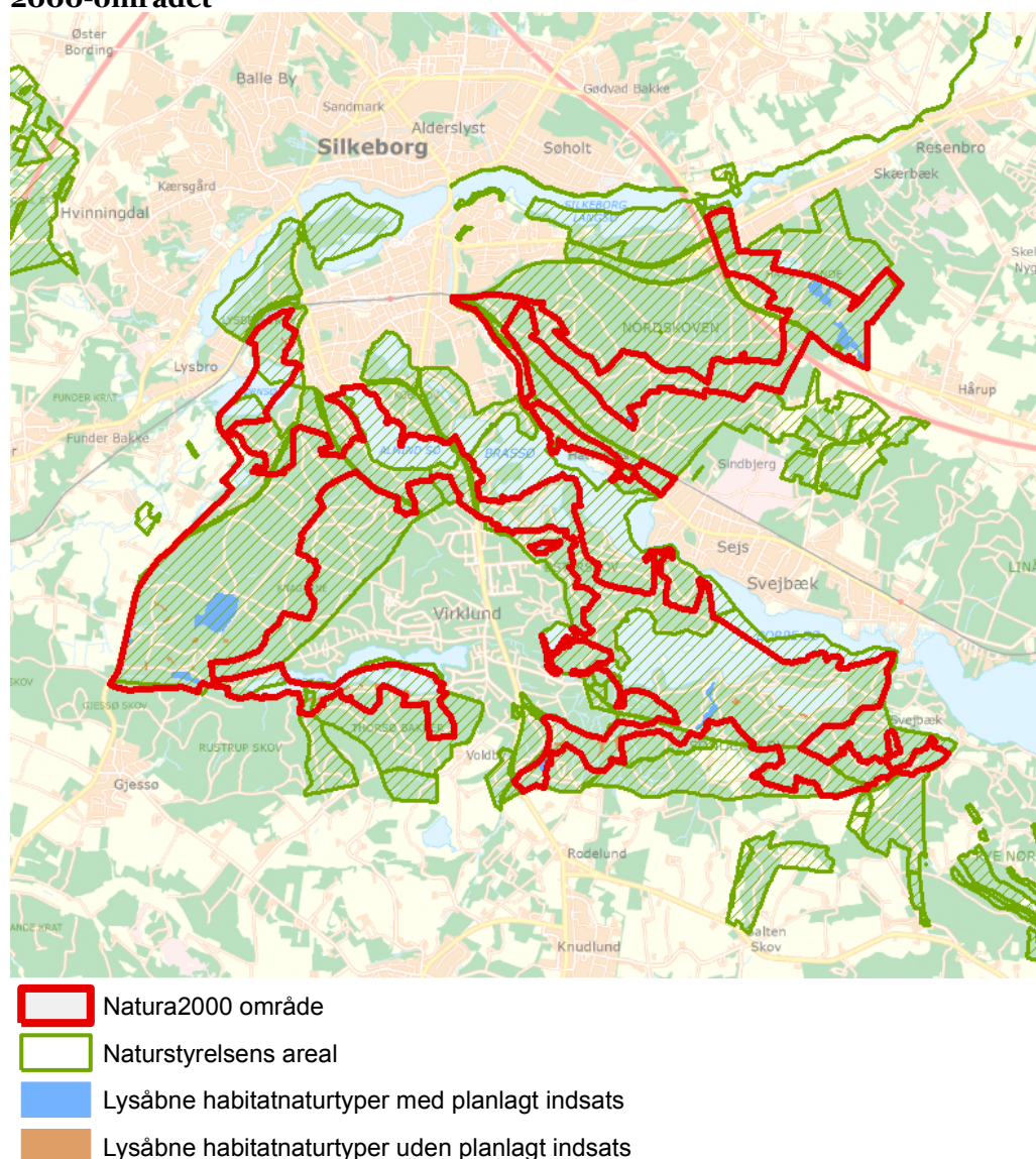
Figur 3: Oversigt over lysåbne naturtyper og planlagte indsatser i Natura 2000-området

Plejeplanen er udarbejdet i overensstemmelse med Natura 2000-planens målsætninger og adresserer konkret følgende specifikke retningslinje fra Natura 2000-planens indsatsprogram: