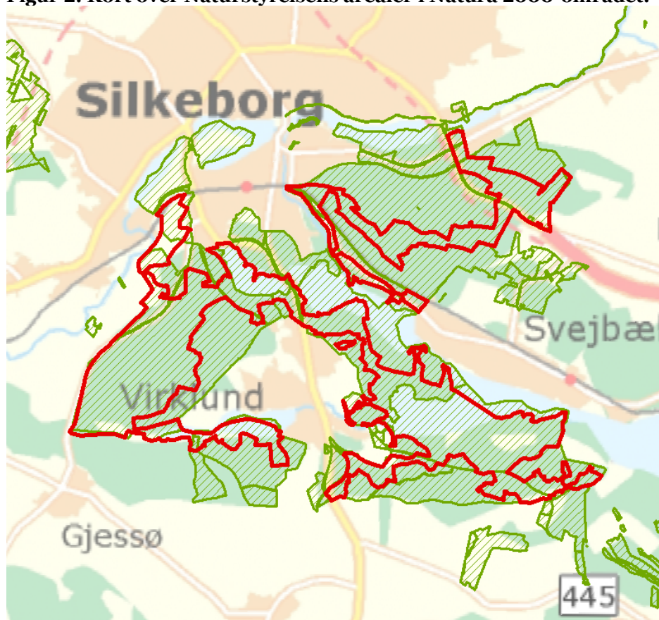
Figur 2: Kort over Naturstyrelsens arealer i Natura 2000-området.