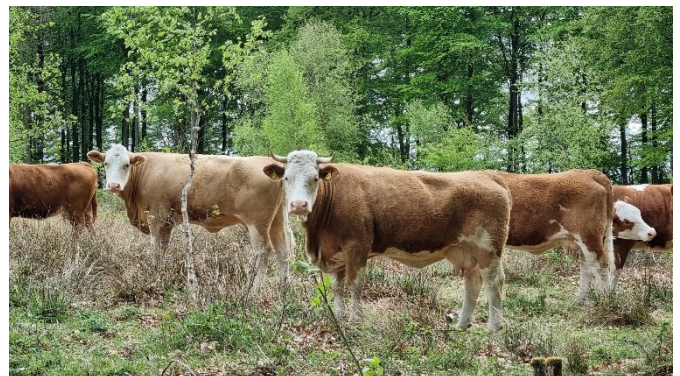
Skovgræsning i Skindbjerglund med kvæg.