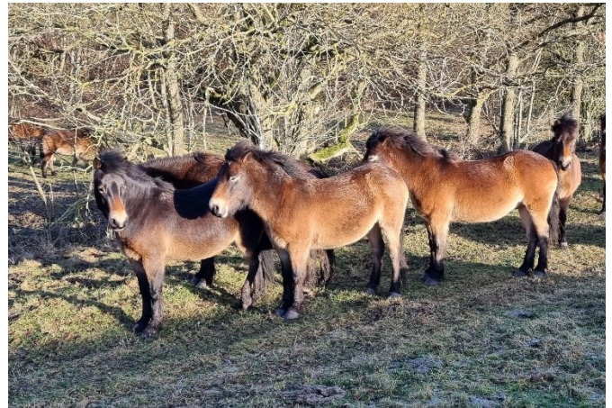
Helårsgræsning med exmoor ponyer.

Der er 3 gravhøje i området, og omkring Skindbjerglund er der jorddiger. For sikring af jorddigerne imod beskadigelse af de græssende dyr er der etableret en del indre hegnslinjer, der sikrer, at dyrene kun kan passere på udvalgte steder.