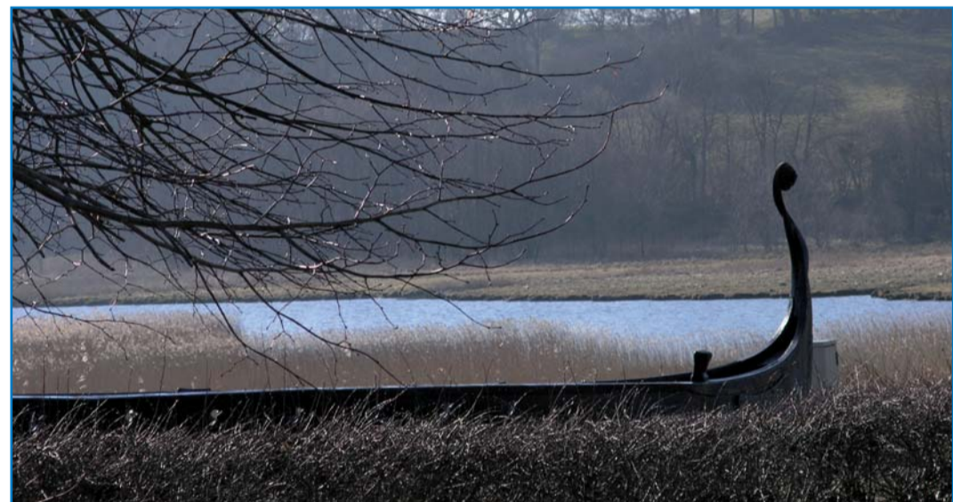
Vikingskibet Imme Gram