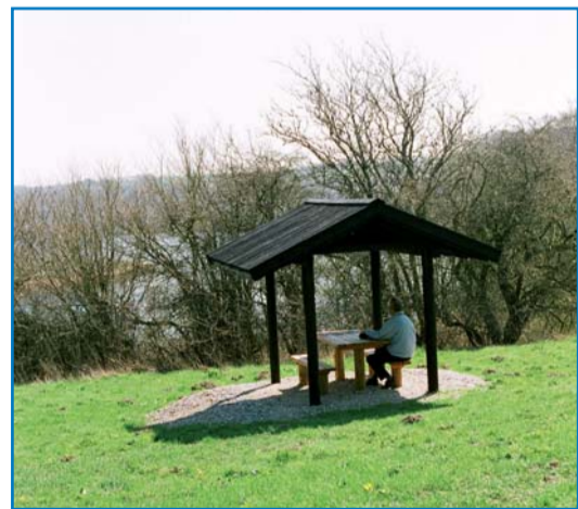
Madpakkehuset ved Kalvø-stien