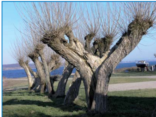
De gamle popler