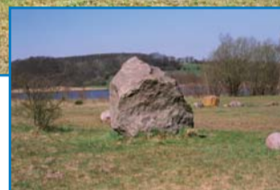
Varberg Charnokit, Halland