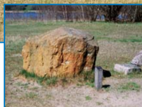
Kambrisk Sandsten, Skåne