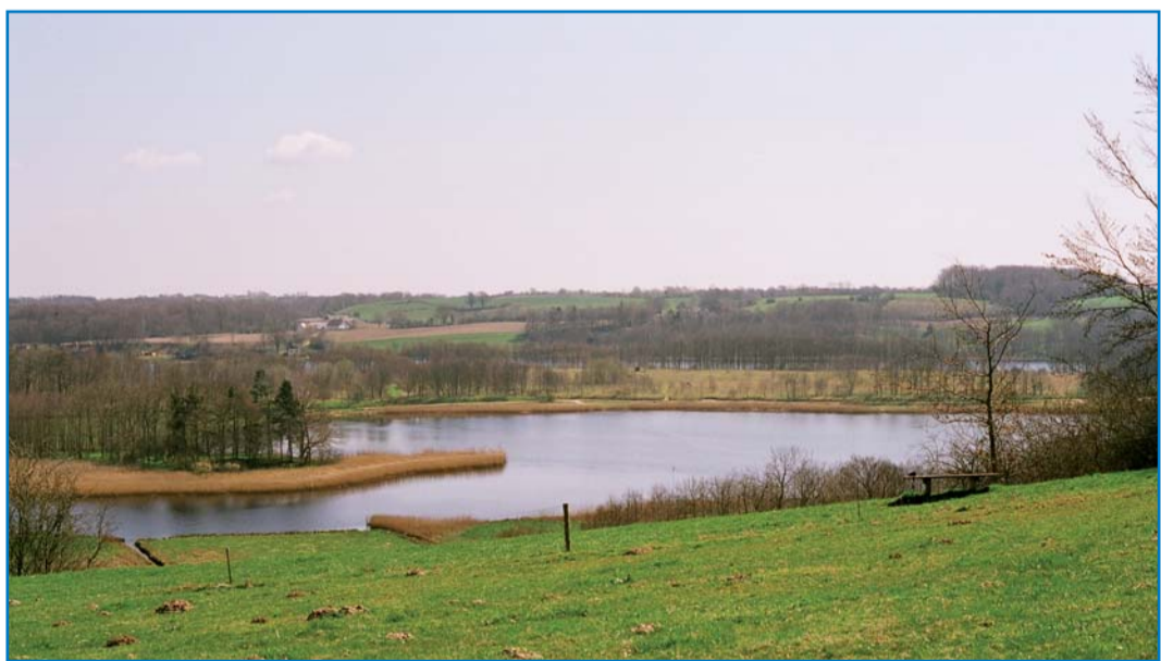
Udsigt fra Kalvøstien

Genner bugt og dens forlængelse ind i landet, er en gammel tunneldal, skabt af store smeltevandsfloder under isen i sidste istid. Bugten er omgivet af store bløde bakker, der bølger langt ind i land, for til sidst at munde ud i de store flade smeltevandsletter vest for isens hovedopholdslinje. Selve Kalvø er egentlig blot endnu en bakke i landskabet, men altså en bakke der stiger op af vandet og derved bliver til en ø. Grusgravning på øen i 1960'erne, har dog fjernet de øverste 8 meter af bakken og idag fremstår Kalvø som en flad, støvleformet ø, med små idylliske bugte. Øen ligger godt beskyttet for vind og vejr, bag det lægivende fastland, der næsten helt omgiver øen, bortset fra mod øst, hvor Genner bugt løber ud i Lillebælt. Her ved udgangen til Lillebælt ligger dog øen Barsø, som også giver læ til bugten. Disse lægivende betingelser gør Kalvø ideel for både fugle og lystsejlere, der kan søge naturligt ly for vejrliget.