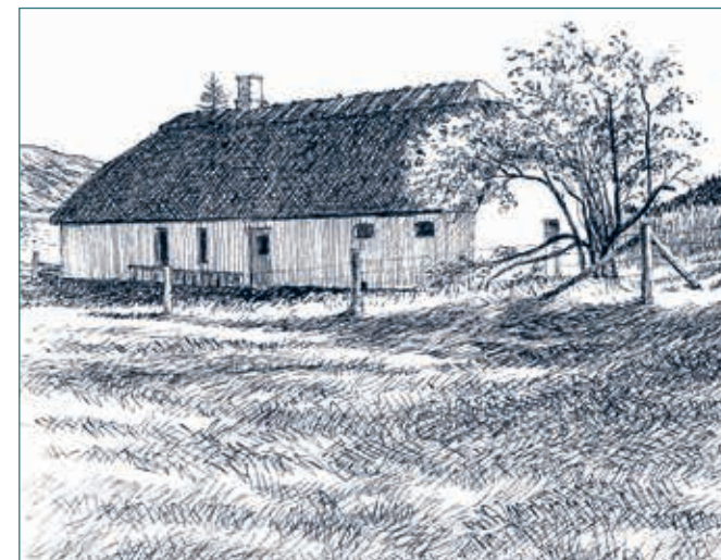
Lars Kjærs Hus