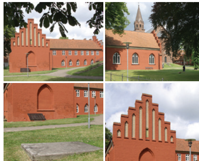
Sortebrødre Kloster og Skt. Nikolaj Kirke

Midt i Holbæk ligger Sortebrødreklostret sammen med Skt. Nikolaj Kirke. Klostret blev bygget i middelalderen af tiggermunke og var, da det var størst, et firefløjet anlæg omkring en åben klostergård. Munkene levede på stedet indtil 1535, hvor de blev sultet ud af byen af byens borgere under borgerkrigen mellem Christian d. 3. og Christoffer af Oldenburg. Dele af anlægget blev herefter revet ned på kongens befaling, men i 1575 indrettedes Holbæks første rådhus i de tilbageblevne bygninger, og tjente som sådan til 1844. Bygningerne findes på adressen Klosterstræde 7 og bruges i dag til sognets menighed. Den oprindelige klosterkirke blev i 1535 til sognekirke og eksisterede indtil 1869, hvor den blev revet ned og erstattet af den nuværende Skt. Nikolaj Kirke.