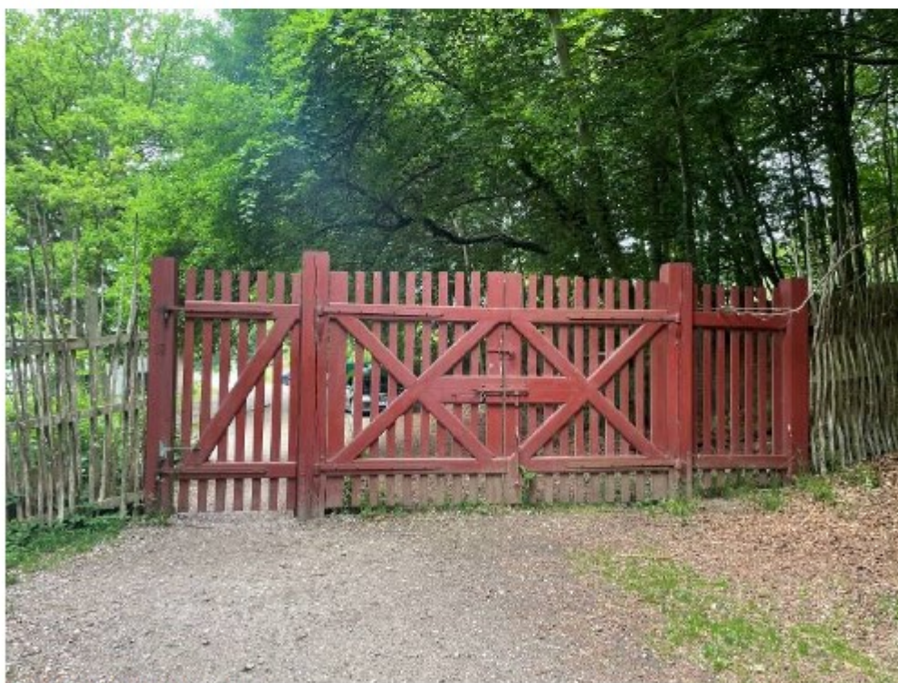
Billede 5. port uden overligger