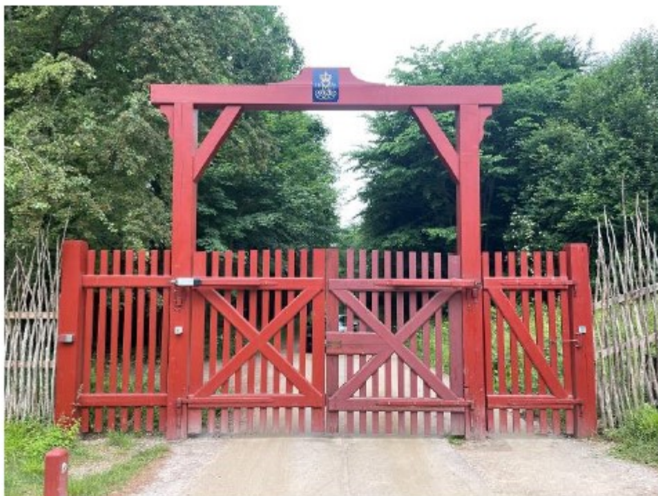
Billede 4. port med overligger