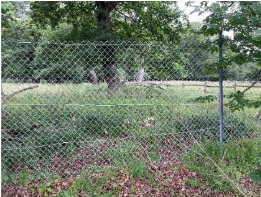
Billede 7. hegn