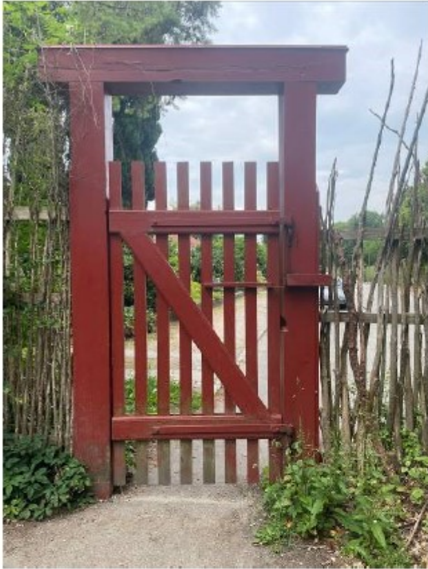
Billede 6. ganglåde