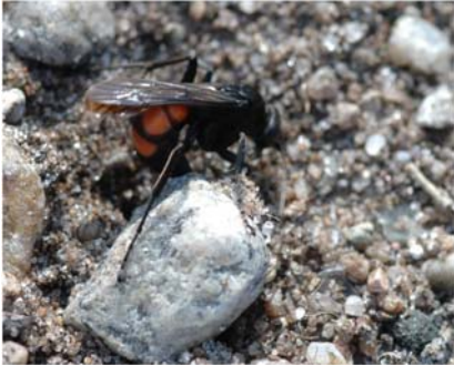
Sandhveps er knyttet til de tørre lavhedearealer

Skrænten giver mulighed for et utroligt udsyn over både stranden, havet og den bagvedliggende hede, som afgræses af Galloway kreaturer. Vegetationen på hedearealerne består hovedsageligt af Hedelyng og revling på de tørre steder og klokkelyng, mosebølle, porse samt indslag af klokke-ensian i de fugtige lavninger.